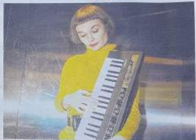
Adelys interprète la chanson française dans ses albums dans toute la France.