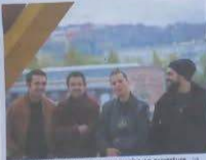
Tin Pal Alley, une formation rouennaise en ouverture. (1)