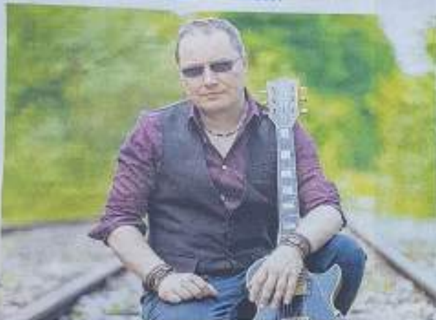
Phil Vermont est associé au collectif acoustique New Black pour son prochain album.